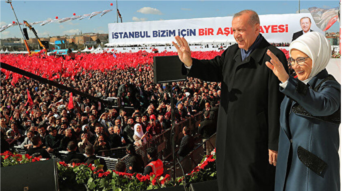
Cumhurbaşkanı Erdoğan ve Emine Erdoğan miting alanında.

Haber Merkezi · 24 Mart 2019, 17:00 · Son Güncelleme: 24 Mart 2019, 17:38 · AA