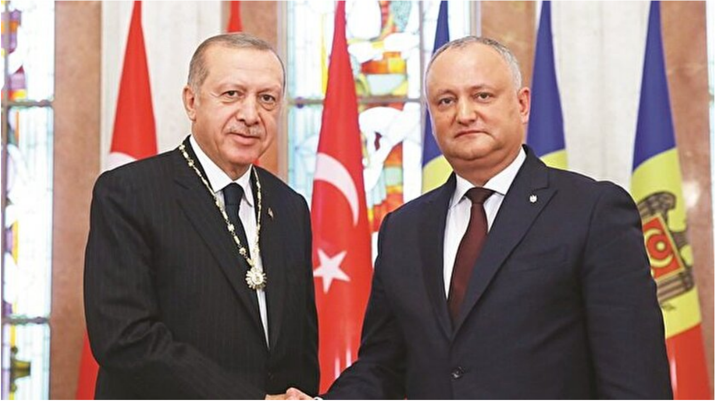
Cumhurbaşkanı Tayyip Erdoğan ve Moldova Cumhurbaşkanı İgor Dodon

Haber Merkezi · 18 Ekim 2018, 04:00 · Yeni Şafak