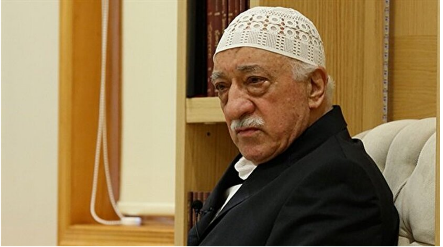
FETÖ elebaşı Fetullah Gülen

Haber Merkezi · 15 Ağustos 2016, 13:02 · Son Güncelleme: 15 Ağustos 2016, 13:08 · AA