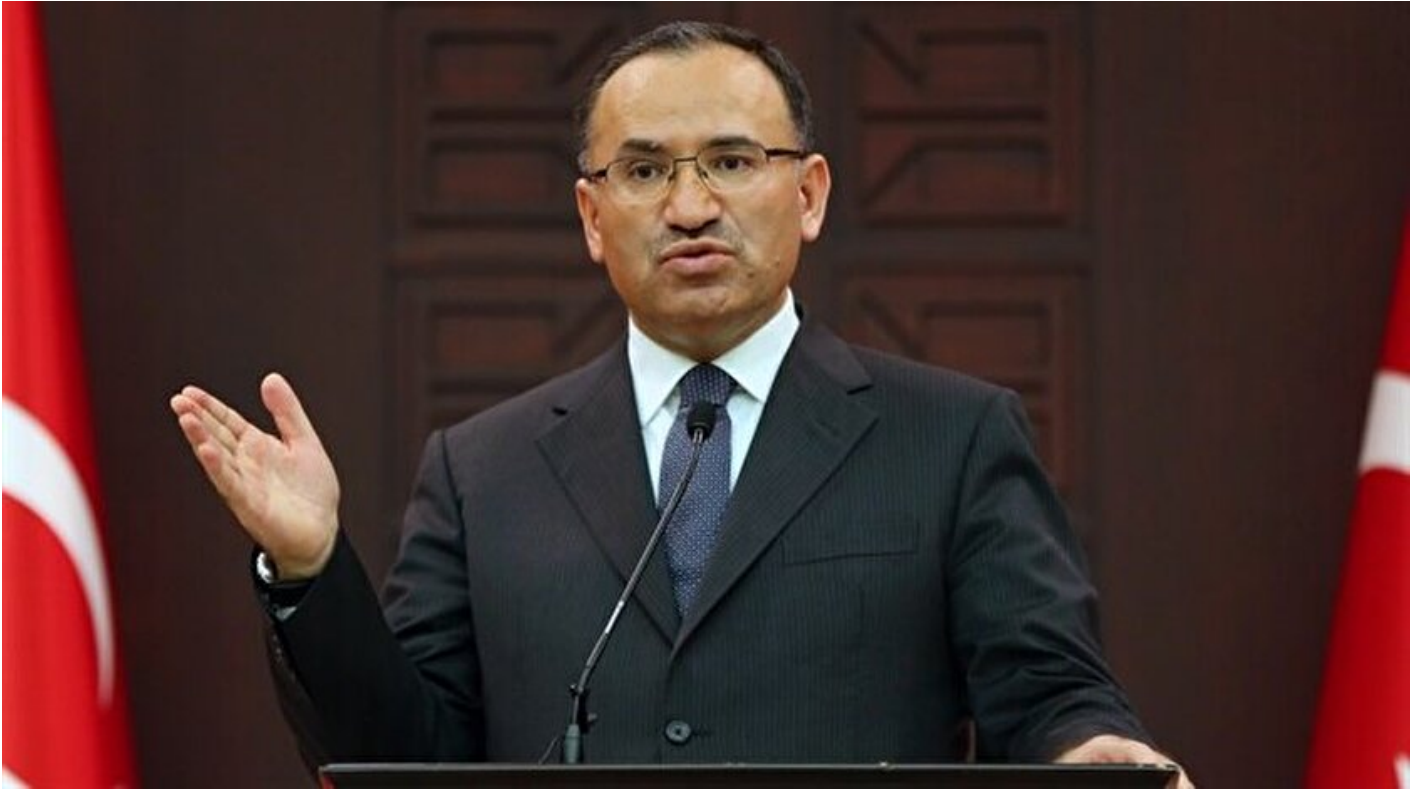
Başbakan Yardımcısı ve Hükümet Sözcüsü Bekir Bozdağ

Haber Merkezi · 27 Mayıs 2018, 18:48 · Son Güncelleme: 27 Mayıs 2018, 18:53 · AA