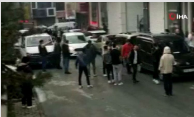
Uçan tekmeli kavga: Kaldırım taşları havada uçtu