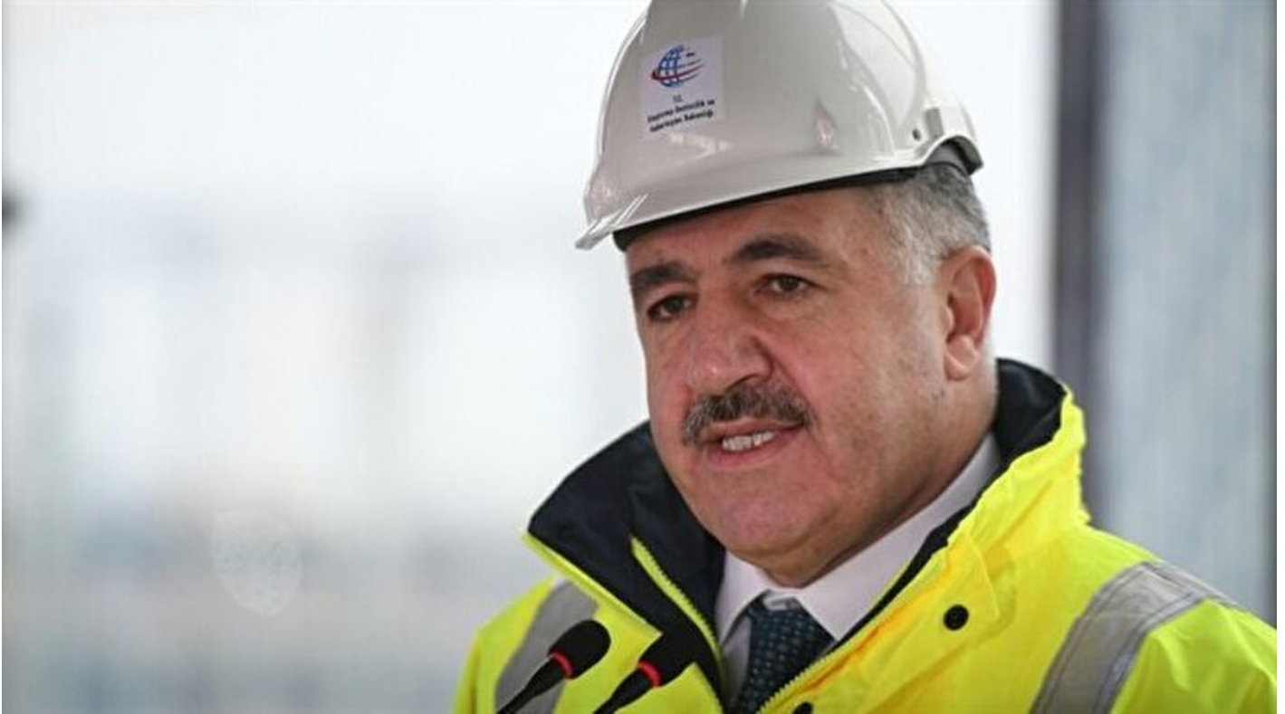
Ulaştırma, Denizcilik ve Haberleşme Bakanı Ahmet Arslan

Haber Merkezi · 29 Ağustos 2017, 09:32 · Son Güncelleme: 29 Ağustos 2017, 09:33 · AA