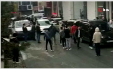
Uçan tekmeli kavga: Kaldırım taşları havada uçtu