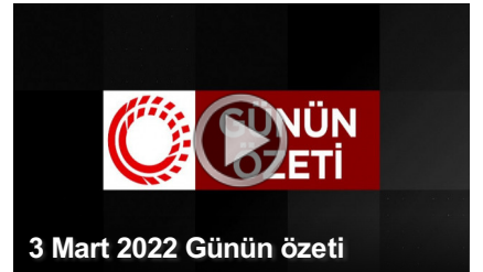
3 Mart 2022 Günün özeti