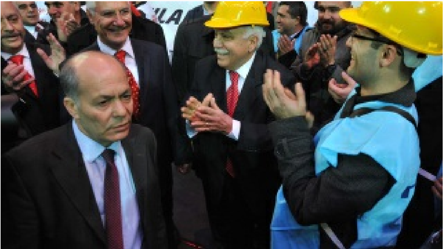
'Sonsuz Nöbetçi'yi arkadaşları anlattı: Parti'nin vicdanı ve neşesiydi