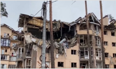
Rus savaş uçakları sivil yerleşim yerlerini bombaladı