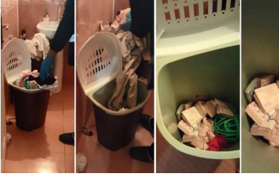
FETÖ'nün gaybubet evindeki kirli sepetinden çıkanlar şok etti

Fetullahçı Terör Örgütü'nün lider ve mensuplarının, sorumlu oldukları eylemler nedeniyle yargılanmak üzere iadelerini sabırsızlıkla beklerken, bu beklentinin karşılanması şöyle dursun, onların tezlerine, söylemlerine ve Türkiye'de tamamlayamadıkları gayrimeşru çabalarına sahip çıkılmasını ikili ilişkilerimizle bağdaştıramıyoruz.