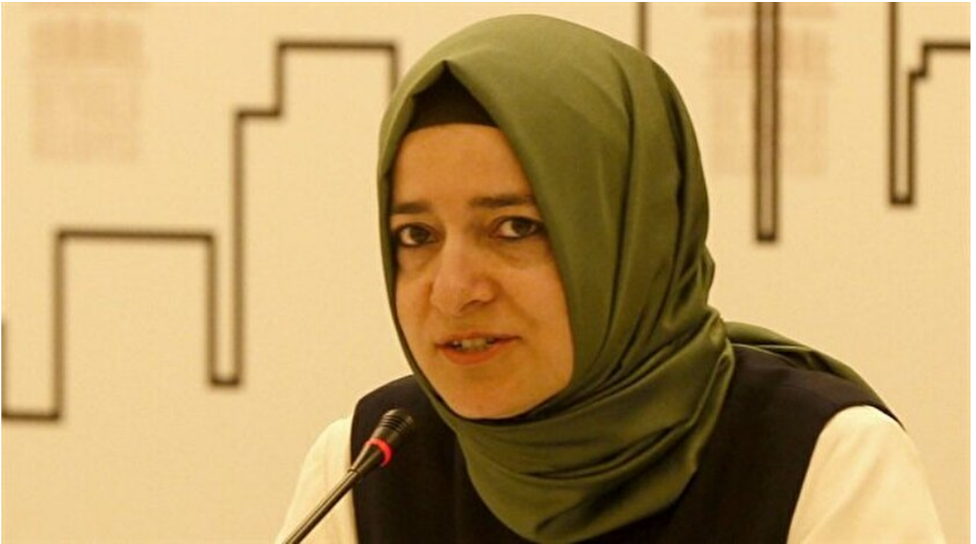
Aile ve Sosyal Politikalar Bakanı Kaya