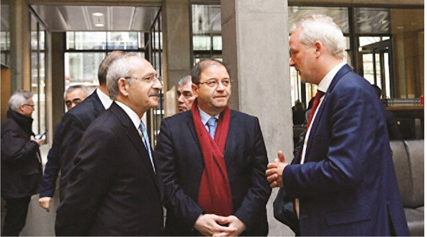
Konstantin Woinoffile - Kemal Kılıçdaroğlu