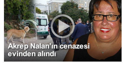
Akrep Nalan'ın cenazesi evinden alındı