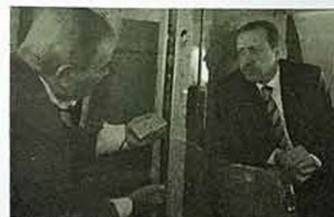
Rahmi Turan, R.Tayyip Erdoğan'la