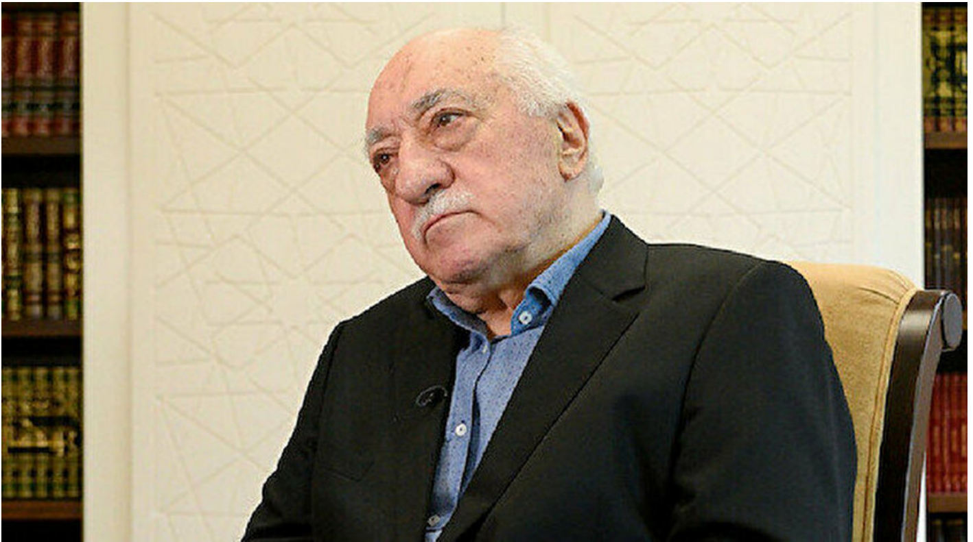
Teröristbaşı Fetullah Gülen