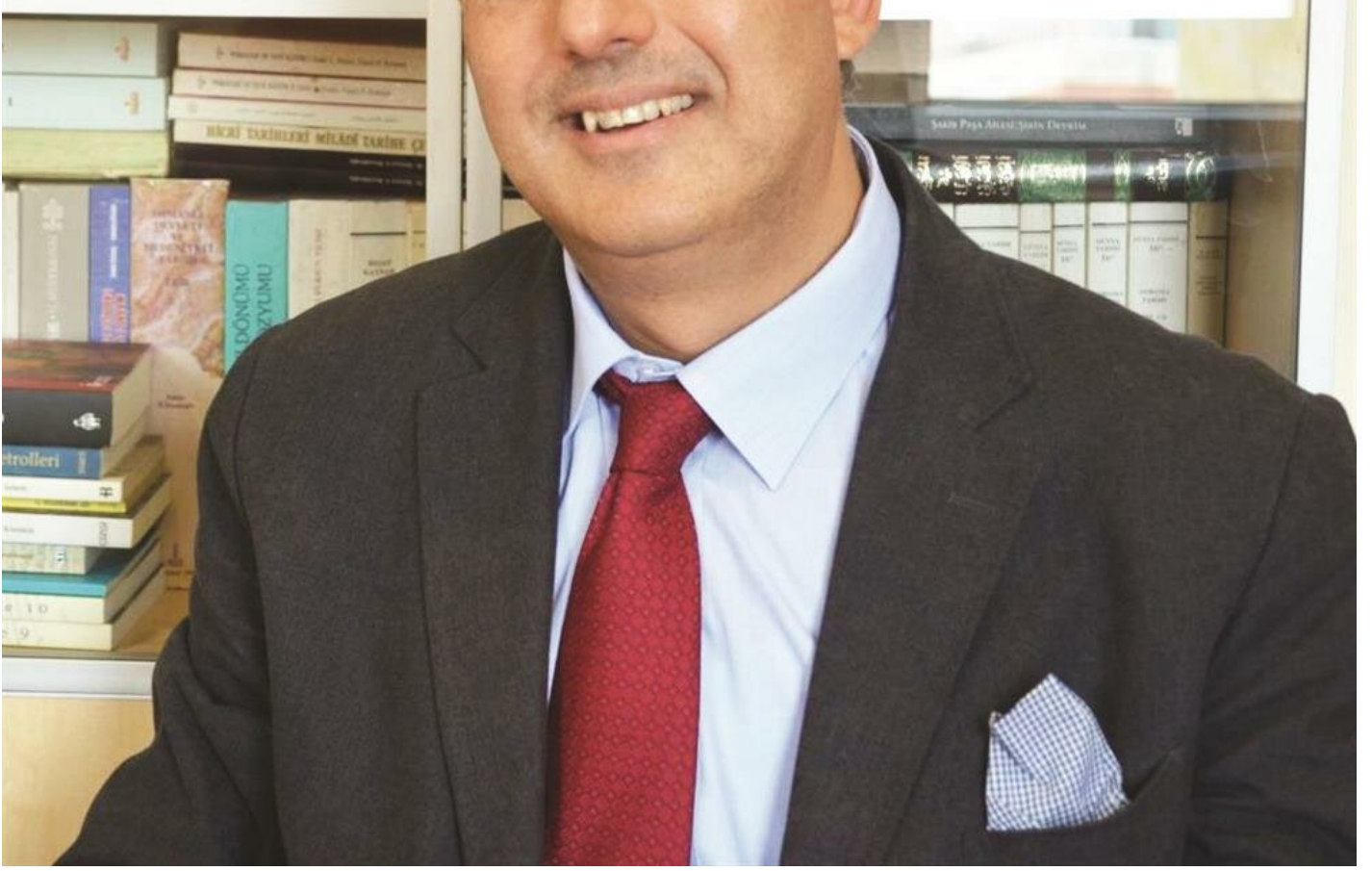
İbrahim Vehbi Baysan