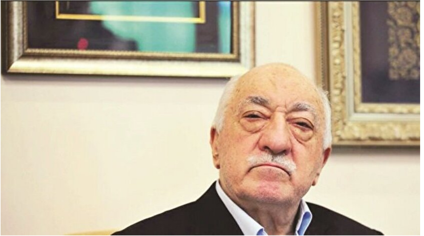
FETÖ elebaşı Fetullah Gülen