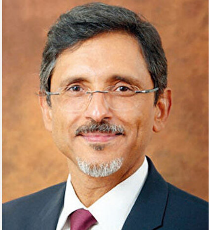
Nadali Pandor ve Ebrahim Patel (Sağda)