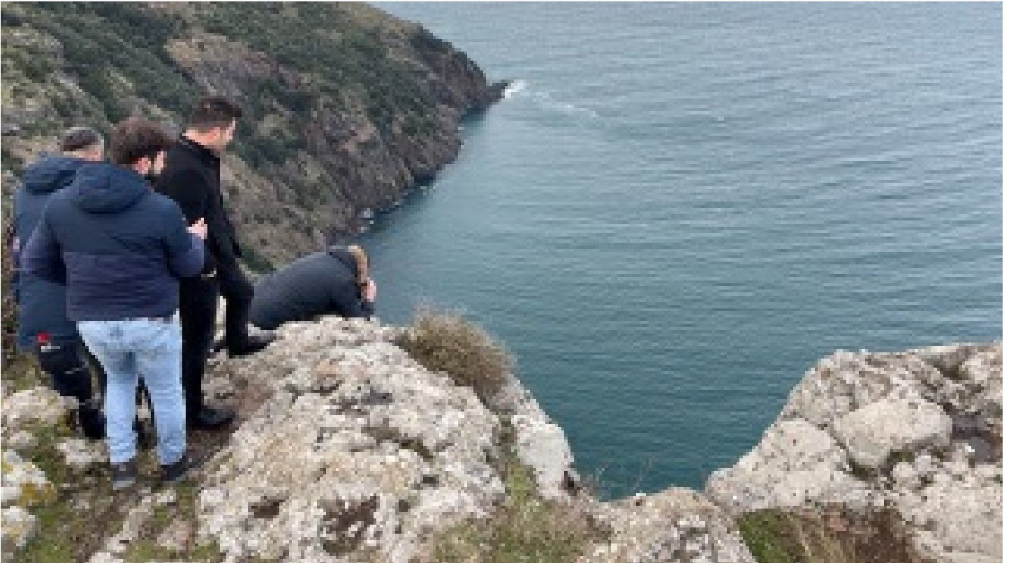
Sinop'ta u¼urumda kadın cesedi bulundu