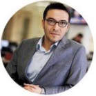
Köksal Akpınar ✓ @KoksalAras