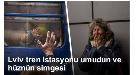
Lviv tren istasyonu umudun ve hüznün simgesi