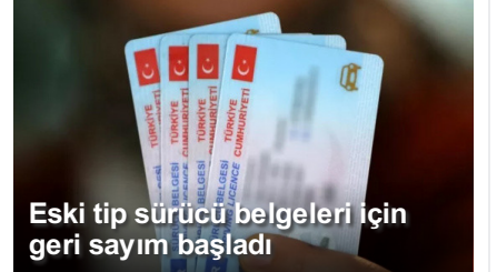
Eski tip sürücü belgeleri için geri sayım başladı