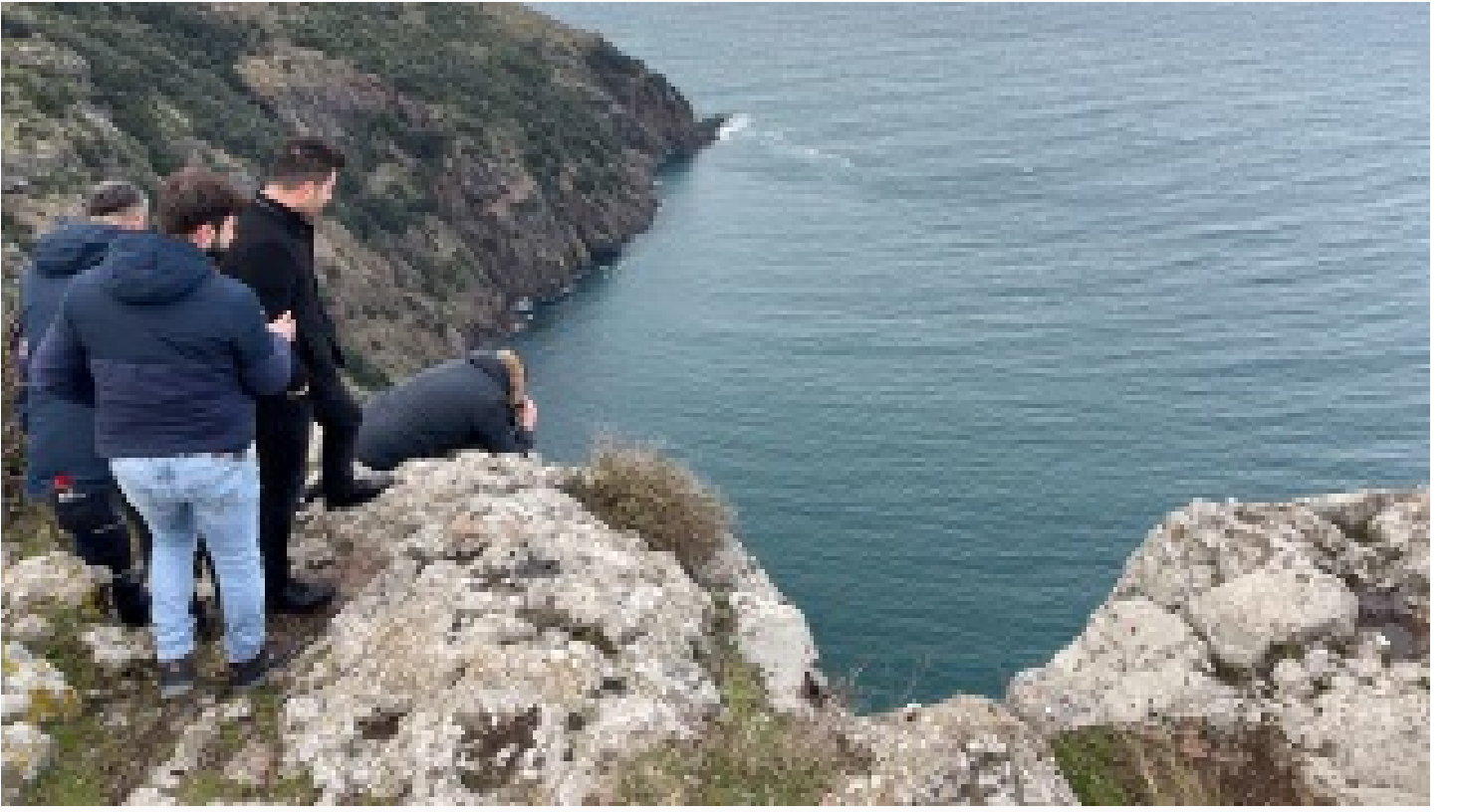
Sinop'ta uçurumda kadın cesedi bulundu