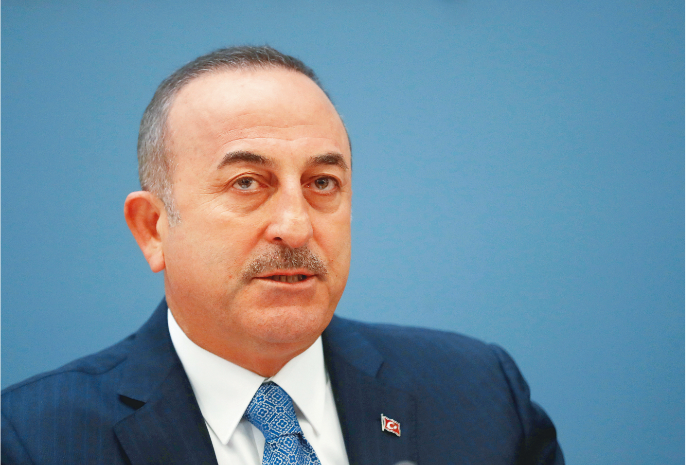
Dışişleri Bakanı Mevlüt Çavuşoğlu

Hakan Atilla Türkiye'ye hareket etmeden önce Twitter hesabından New York JFK Havalimanı'nda Türkiye'nin Washington Büyükelçisi Serdar Kılıç ve New York Başkonsolosu Alper Aktaş ile çekilmiş resmini paylaştı. Atilla mesajında şu ifadelere yer verdi: "Başından beri desteğini ve yardımlarını hiç esirgemeyen Sayın Cumhurbaşkanımız Recep Tayyip Erdoğan' a teşekkürü borç biliyorum. Şu an havaalanındayız. İşlemler bittikten sonra uçağa alınacağız. Bir aksilik olmazsa vatanımıza kavuşmuş olacağız. Elhamdulillah. Ülkemi ve ailemi çok özledim. Sevenlerimize ve desteğini esirgemeyen tüm halkımıza çok teşekkür ediyorum."