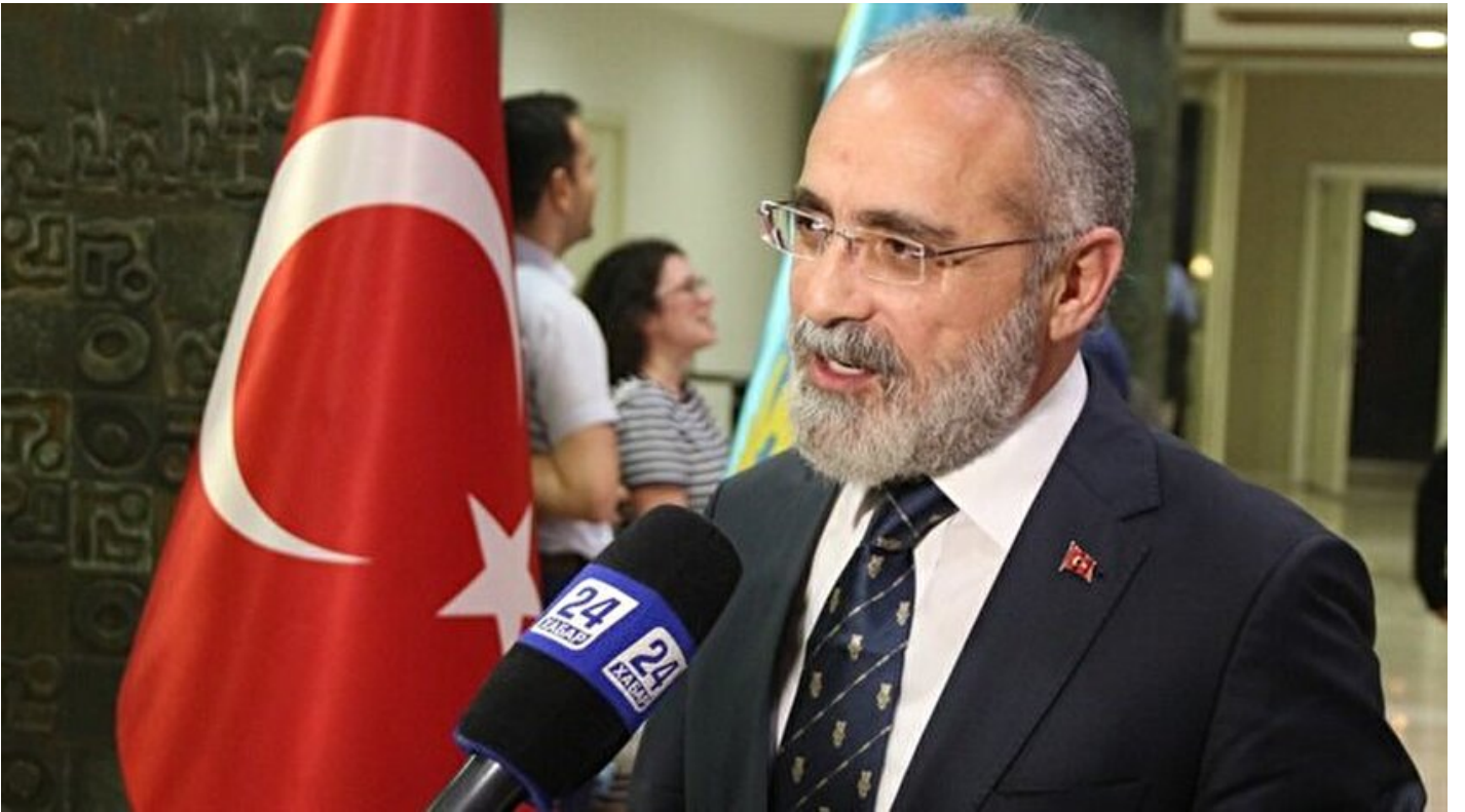
Cumhurbaşkanı Başdanışmanı Yalçın Topçu

Haber Merkezi · 23 Haziran 2018, 13:14 · Son Güncelleme: 23 Haziran 2018, 13:21 · Yeni Şafak