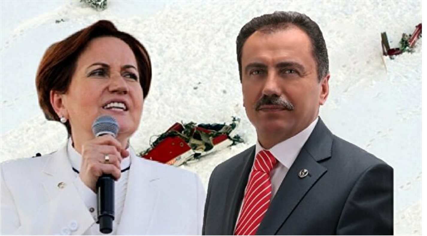
Muhsin Yazıcıoğlu-Meral Akşener

Haber Merkezi · 25 Ekim 2017, 12:40 · Son Güncelleme: 25 Ekim 2017, 15:20 · Yeni Şafak