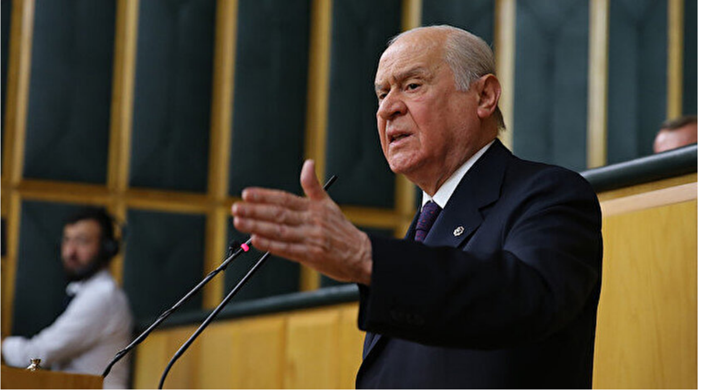
MHP genel Başkanı Devlet Bahçeli

Haber Merkezi · 08 Ocak 2019, 11:17 · Son Güncelleme: 08 Ocak 2019, 11:32 · Yeni Şafak