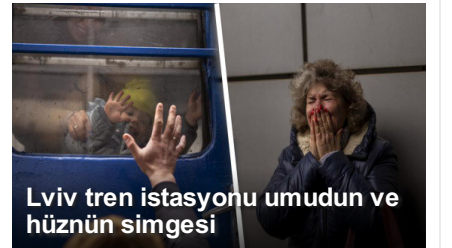
Lviv tren istasyonu umudun ve hüznün simgesi