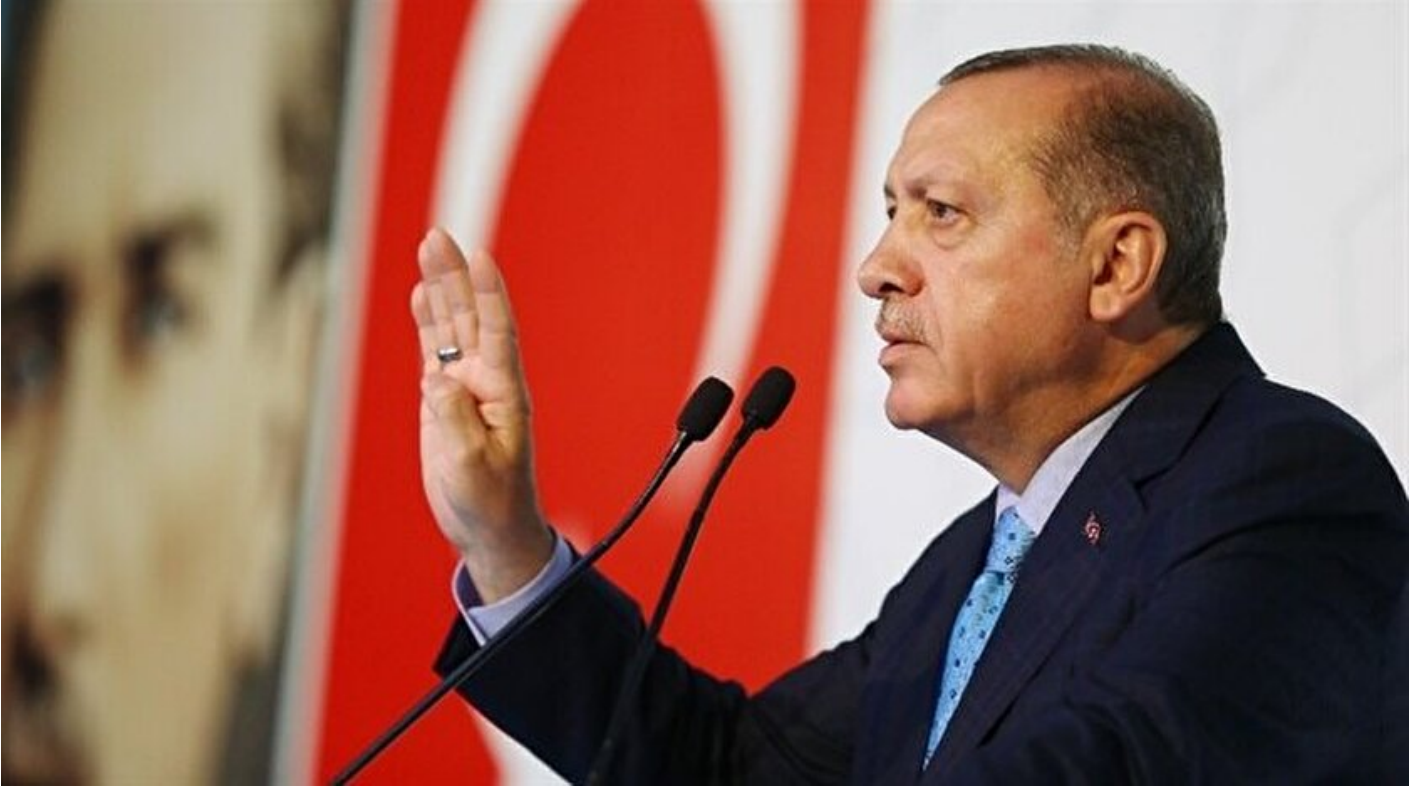
Recep Tayyip Erdoğan

Haber Merkezi · 07 Haziran 2017, 21:25 · Son Güncelleme: 07 Haziran 2017, 22:16 · AA