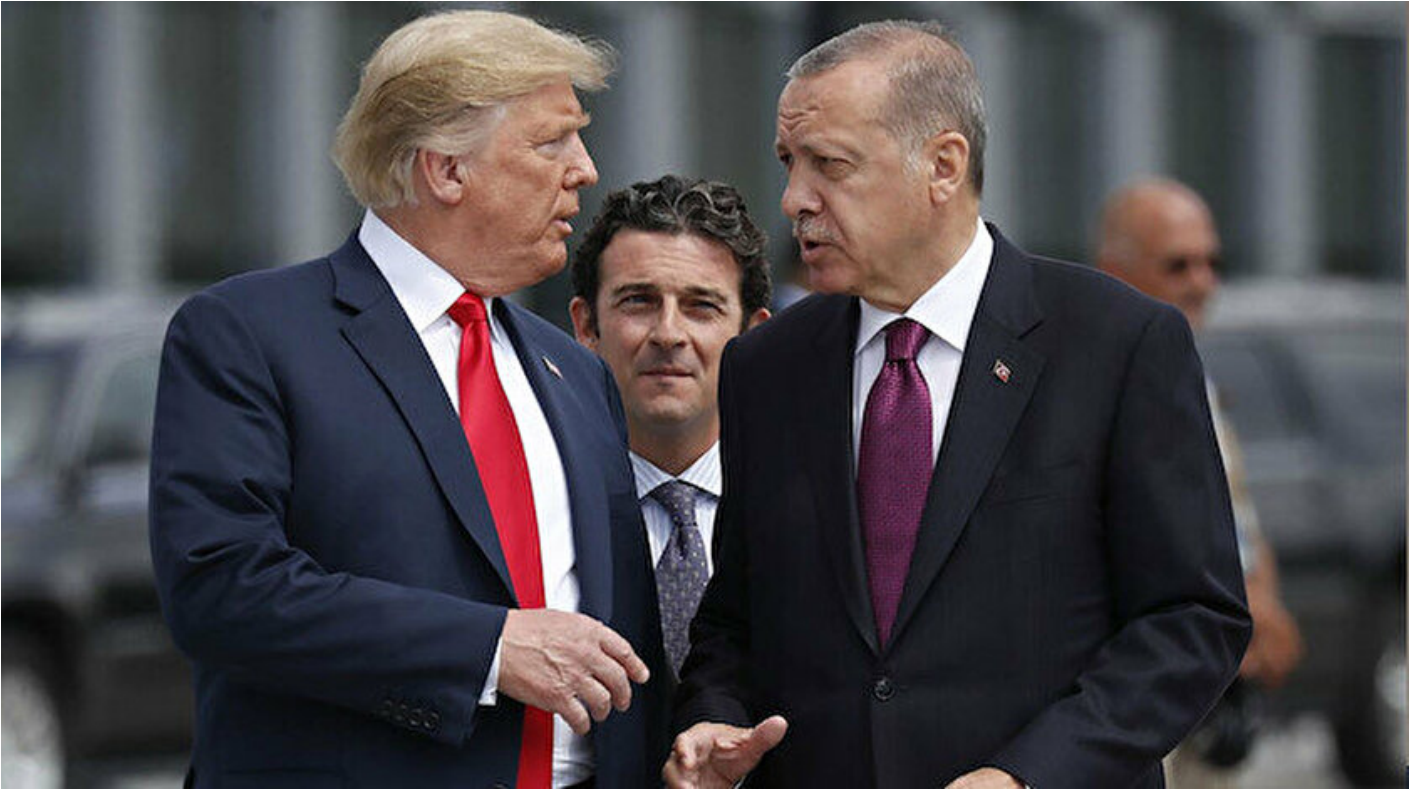
Cumhurbaşkanı Erdoğan-ABD Başkanı Trump