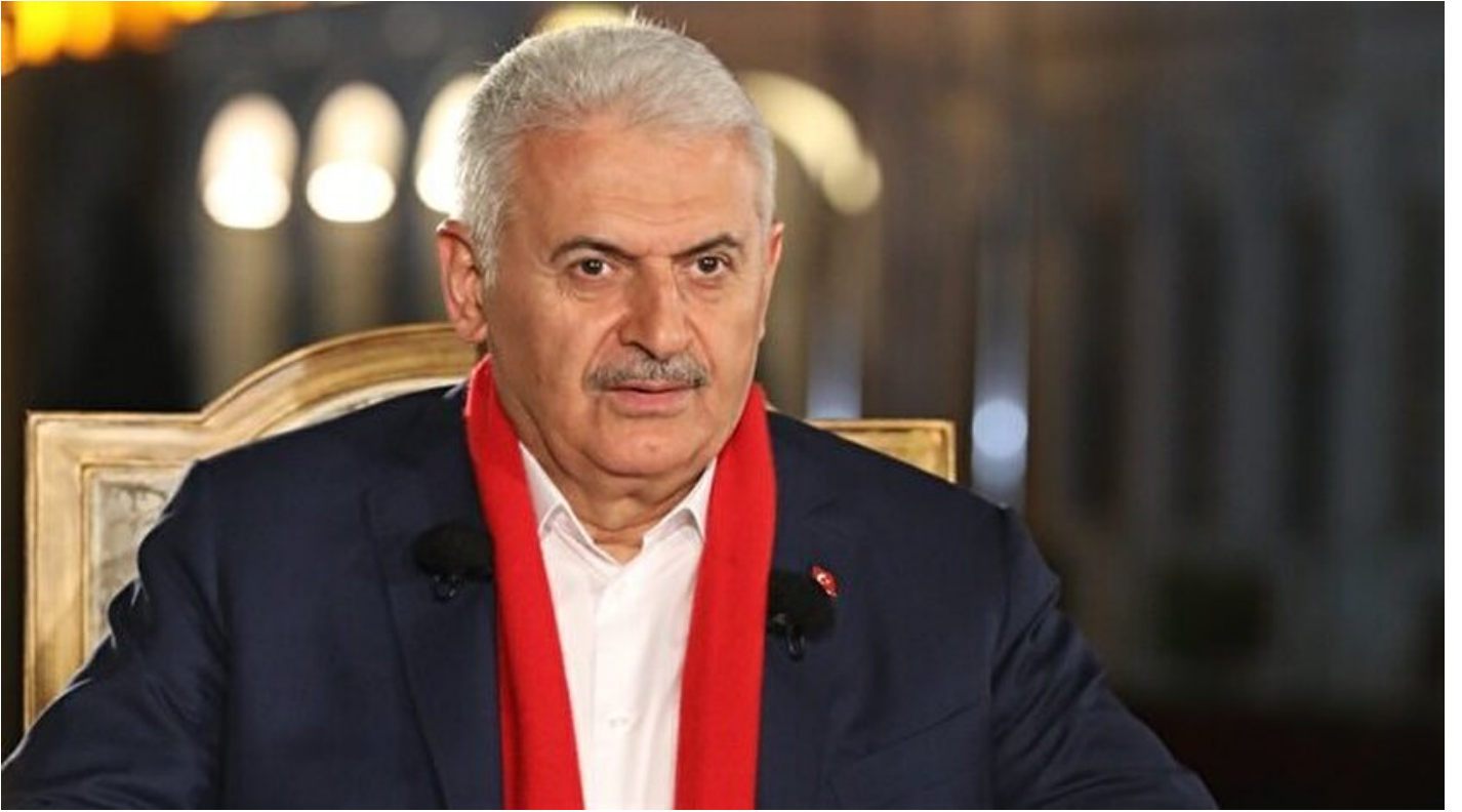
Başbakan Binali Yıldırım