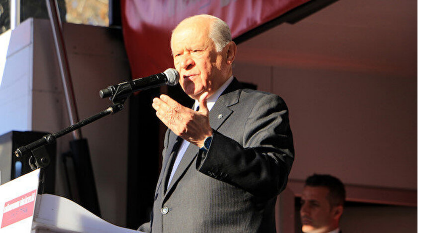
MHP Genel Başkanı Devlet Bahçeli

Haber Merkezi · 21 Mart 2019, 19:11 · Son Güncelleme: 21 Mart 2019, 19:22 · AA