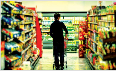
Uzmanı açıkladı: Gıdalardaki hileyi nasıl anlarız?