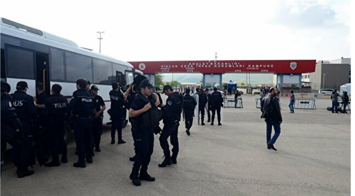
Sincan Ceza İnfaz Kurumları Kampüsü

Haber Merkezi · 03 Ekim 2018, 14:57 · Son Güncelleme: 03 Ekim 2018, 15:16 · AA