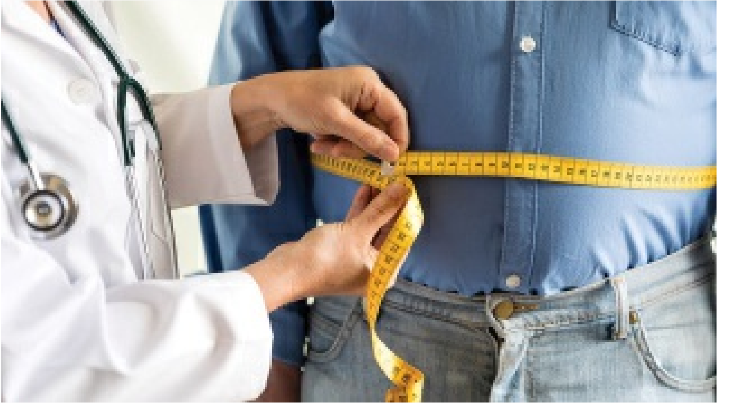
Kovid-19 salgını obeziteyi de artıracak