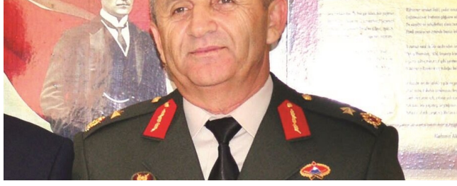
Giresun Jandarma Bölge Komutanı Tuğgeneral Mustafa Doğru