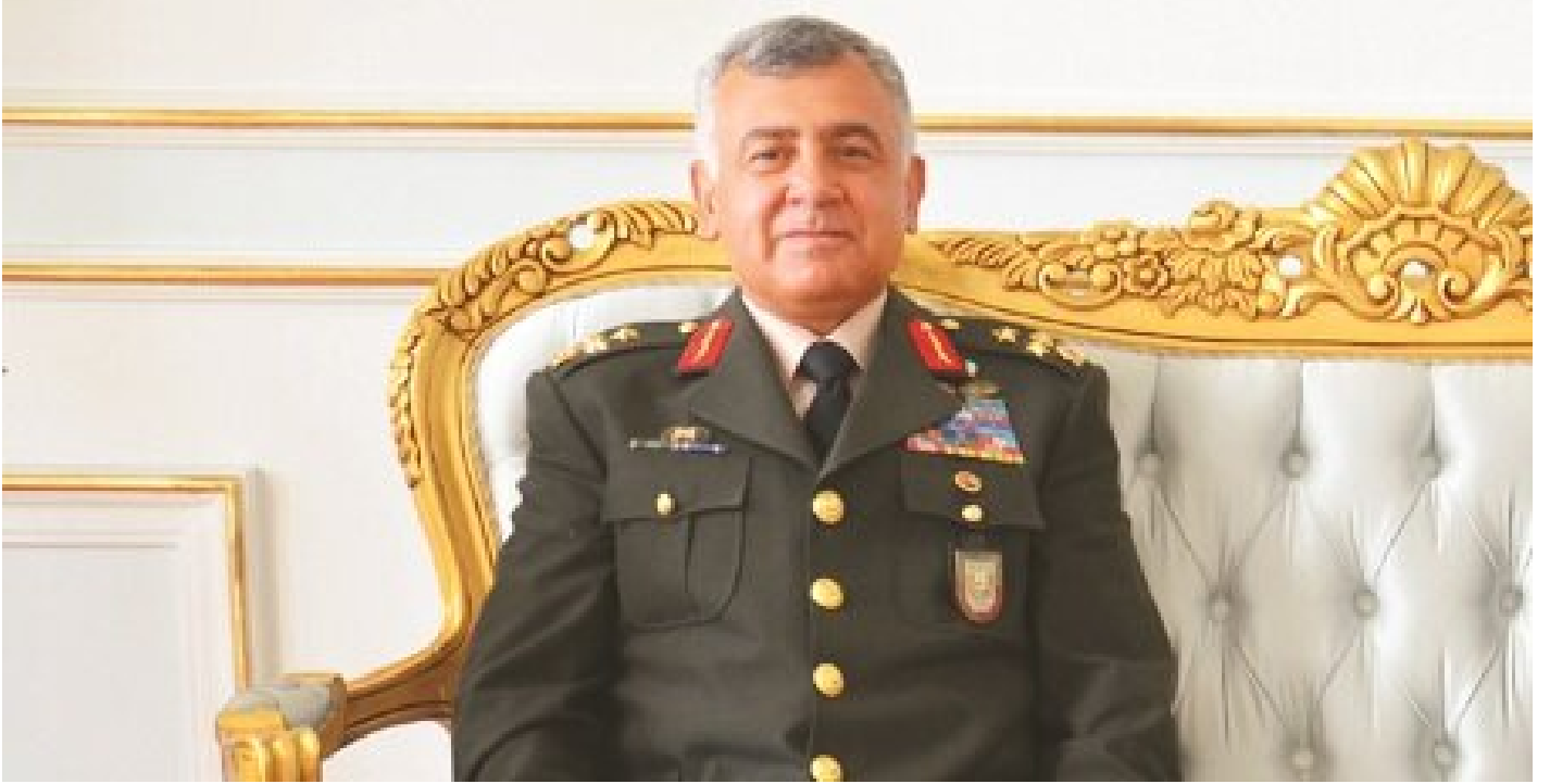
Harp Akademileri Komutanı Korgeneral Tahir Bekiroğlu

Orgeneral Mendi'nin emekliliği ile birlikte Kara Kuvvetleri'ndeki korgenerallerden biri orgeneralliğe terfi edecek. Orgenerallik için rütbesinde 4 yılını doldurmuş 7 korgeneral ile 3 yıllık 5 korgeneral aday listesinde yer alıyor. Orgeneral adayları arasında Harp Akademileri Komutanı Korgeneral Tahir Bekiroğlu ilk sırada ve kulislerde de Bekiroğlu orgenerallik için en güçlü aday olarak gösteriliyor.