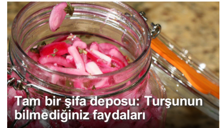
Tam bir şifa deposu: Turşunun bilmediğiniz faydaları