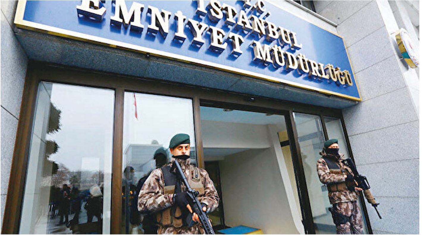
İstanbul Emniyet Müdürlüğü