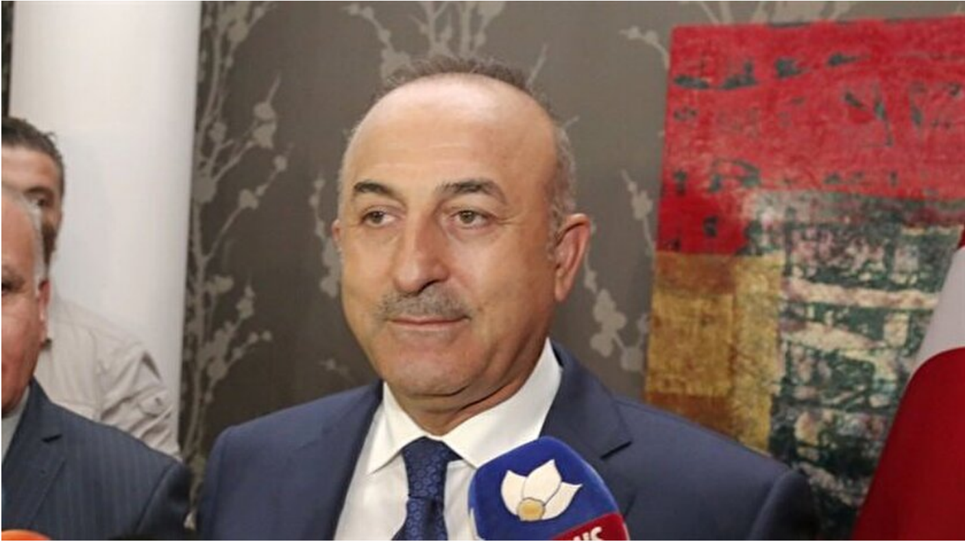
Dışişleri Bakanı Mevlüt Çavuşoğlu