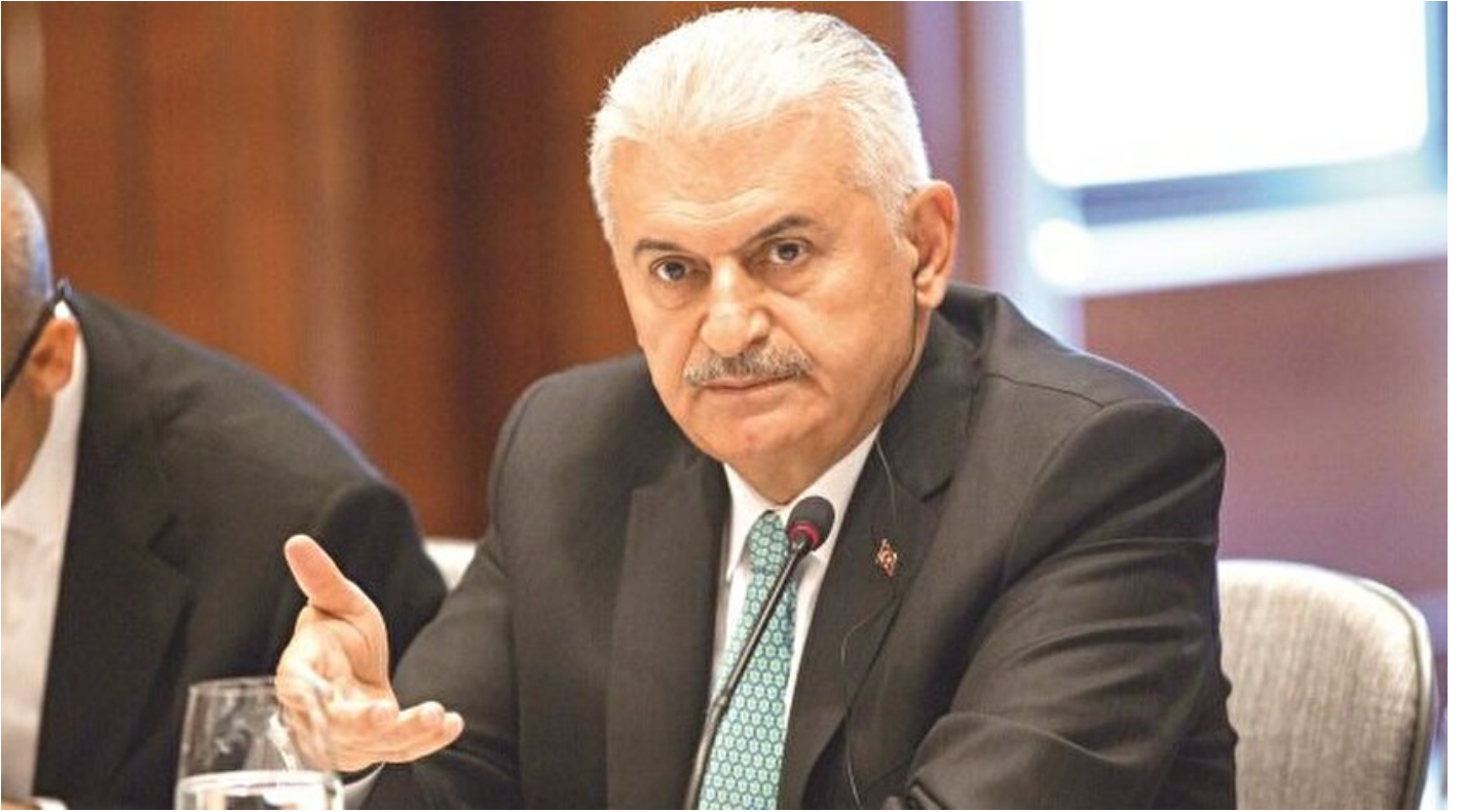
Başbakan Binali Yıldırım