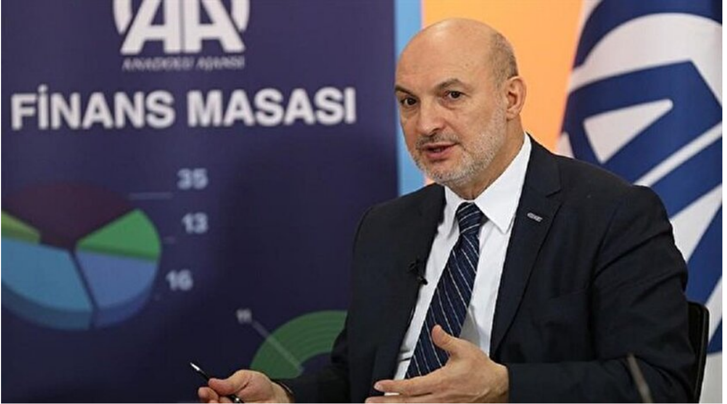
DEİK Başkanı Ömer Cihad Vardan

Haber Merkezi · 09 Şubat 2017, 16:59 · Son Güncelleme: 09 Şubat 2017, 17:01 · AA