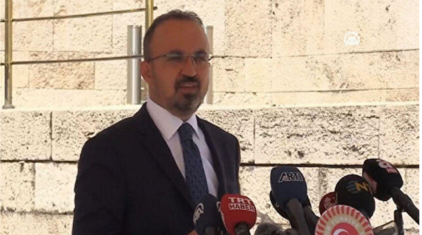
AK Parti Grup Başkanvekili Bülent Turan