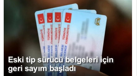
Eski tip sürücü belgeleri için geri sayım başladı