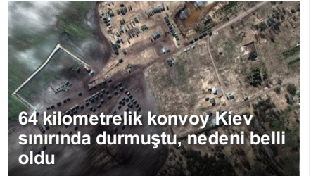
64 kilometrelik konvoy Kiev sınırında durmuştu, nedeni belli oldu