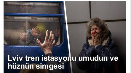
Lviv tren istasyonu umudun ve hüznün simgesi