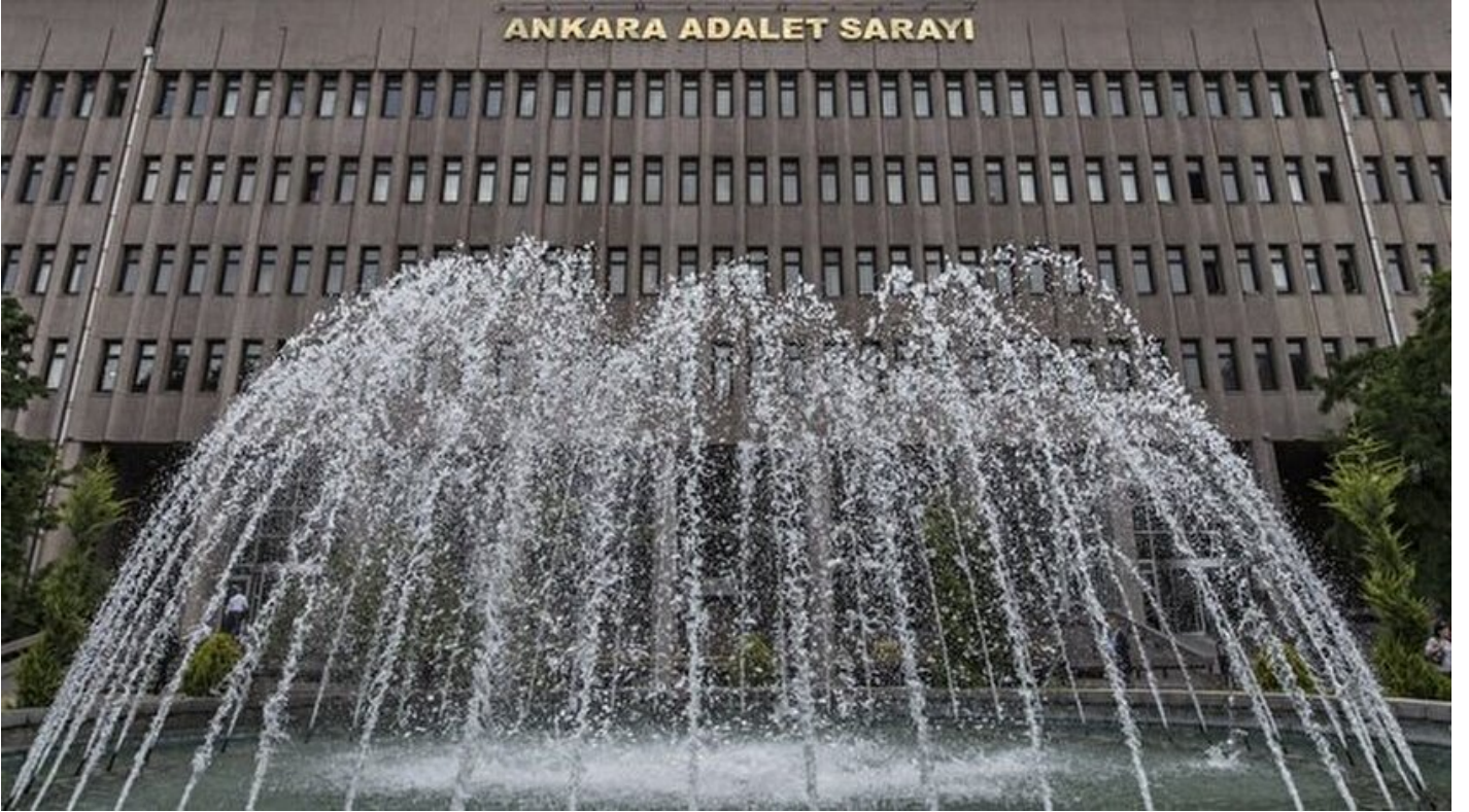
Ankara Adalet Sarayı

Haber Merkezi · 02 Haziran 2017, 17:19 · Son Güncelleme: 02 Haziran 2017, 17:52 · AA