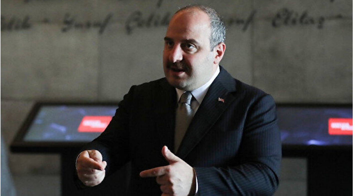
Sanayi ve Teknoloji Bakanı Mustafa Varank.

Haber Merkezi · 15 Temmuz 2020, 12:00 · Son Güncelleme: 15 Temmuz 2020, 12:19 · DHA