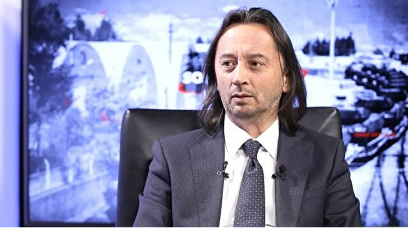
Yeni Şafak Genel Yayın Yönetmeni İbrahim Karagül