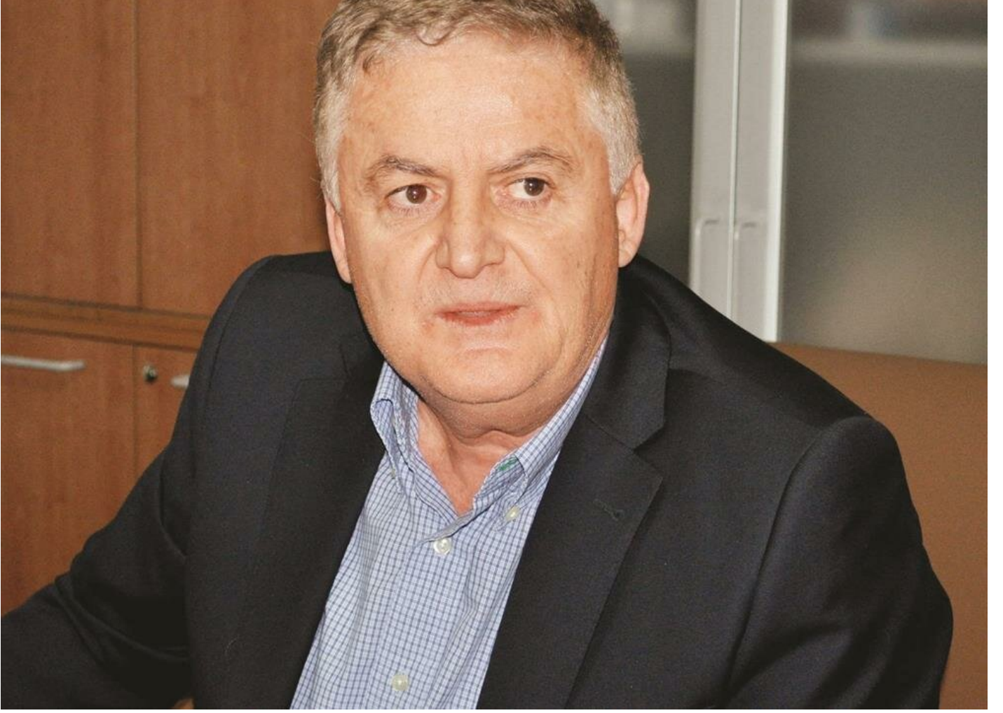
Emekli askeri hakim Ahmet Zeki Üçok