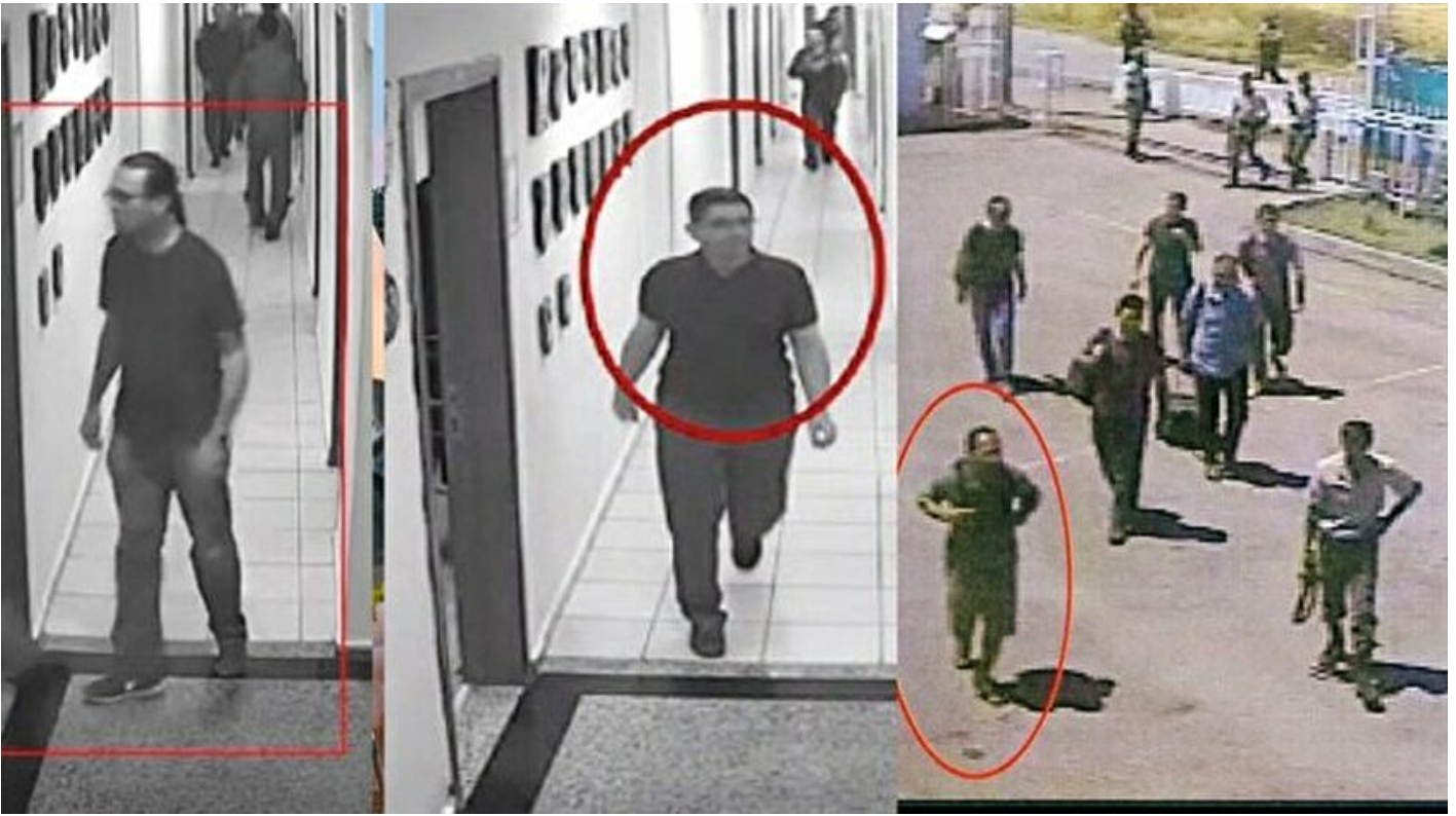
Akıncı'daki 10 sivil kayıp

Osman Özgan · 05 Eylül 2017, 04:00 · Son Güncelleme: 05 Eylül 2017, 17:35 · Yeni Şafak