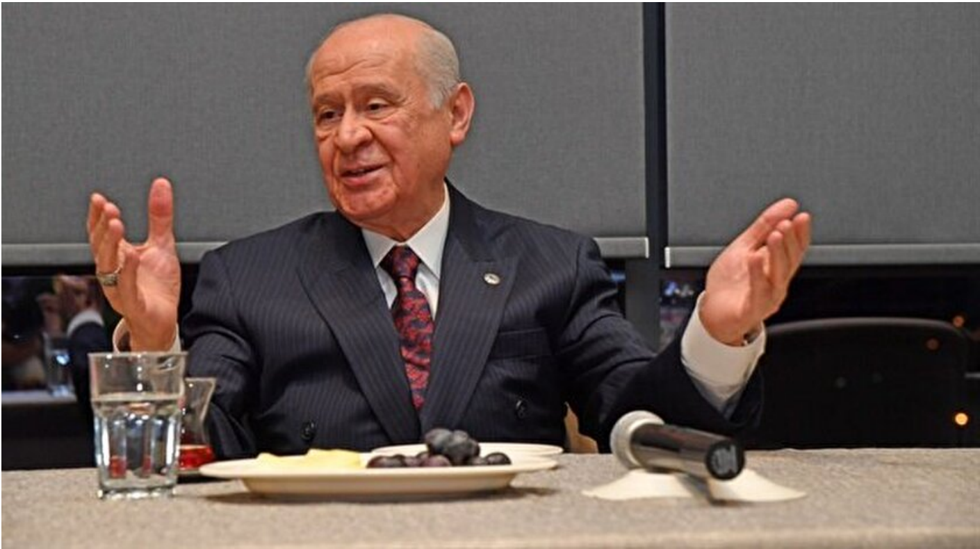
MHP Genel Başkanı Devlet Bahçeli