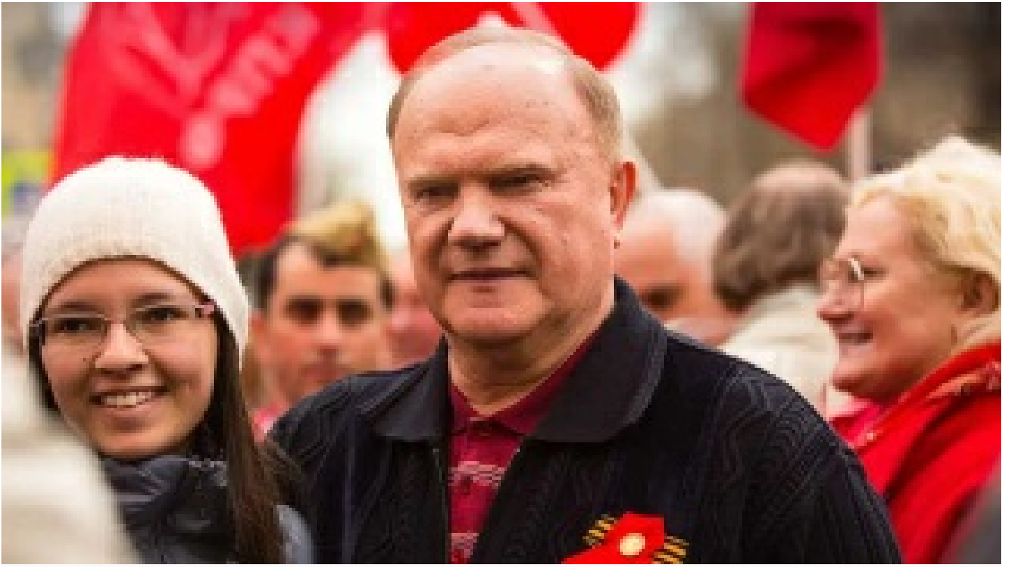
Zyuganov'tan Rusya'nın harekâtına destek